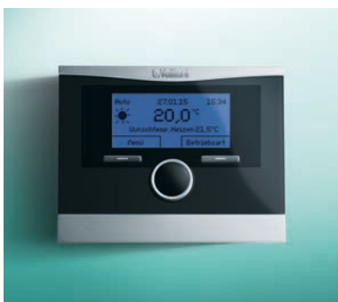
calorMATIC VRC 470f