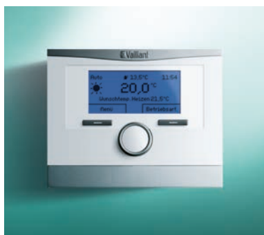
multiMATIC VRC 700