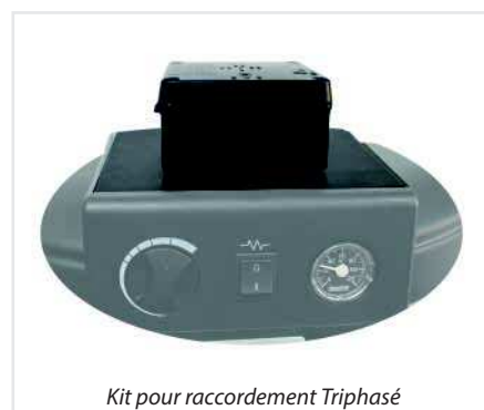
Kit pour raccordement Triphasé